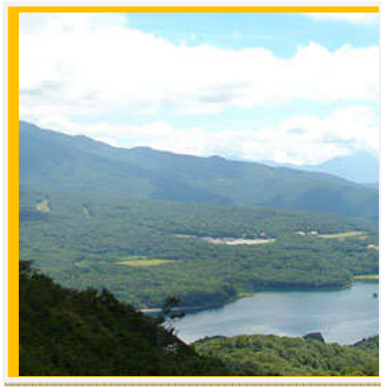
ニヶヶ山頂からの眺望（玉原湖方面）